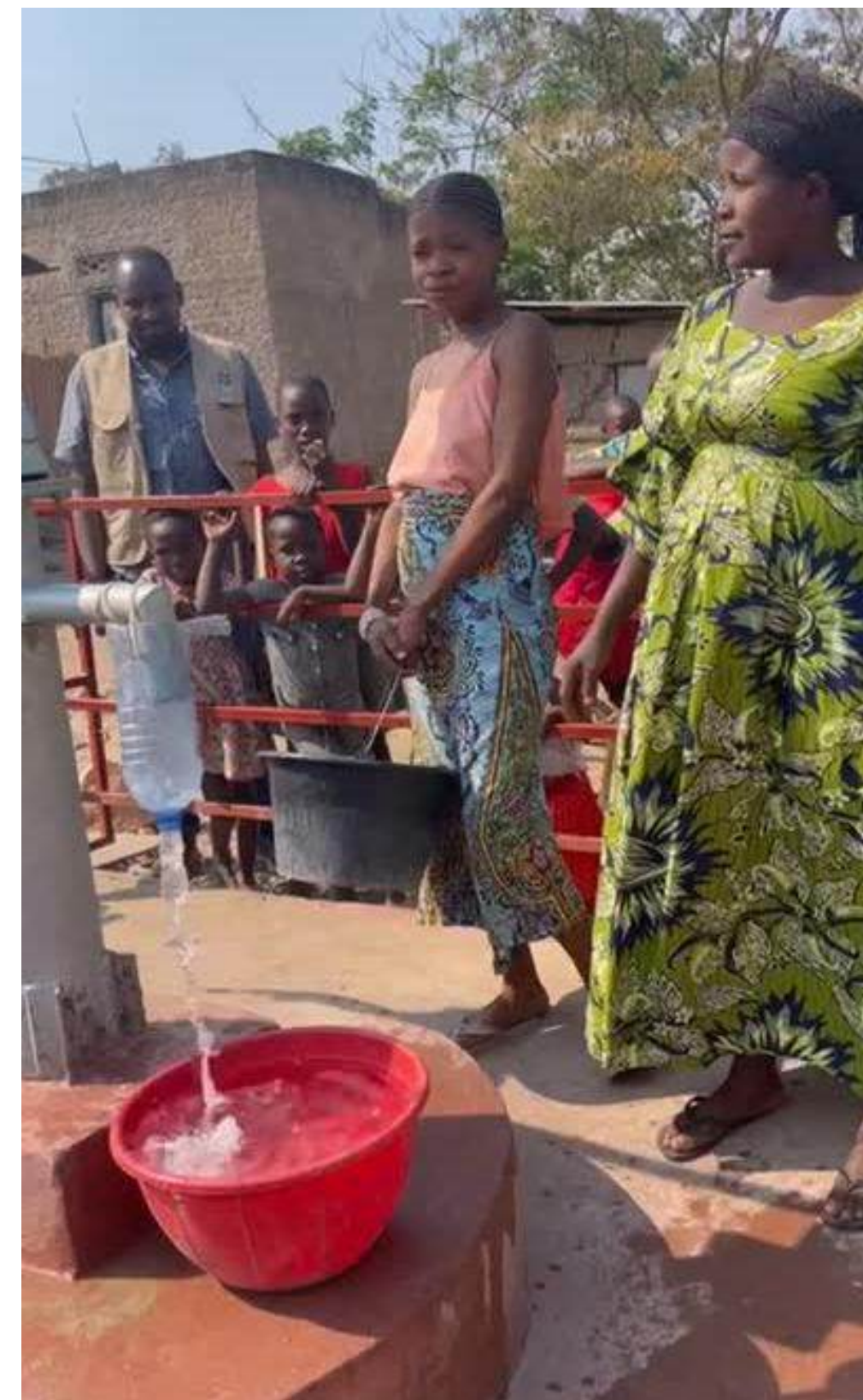
Foto en video: het gebruik van de waterpomp in Kakombe en Kasenga, Uvira, Oktober 2024, © ADED.