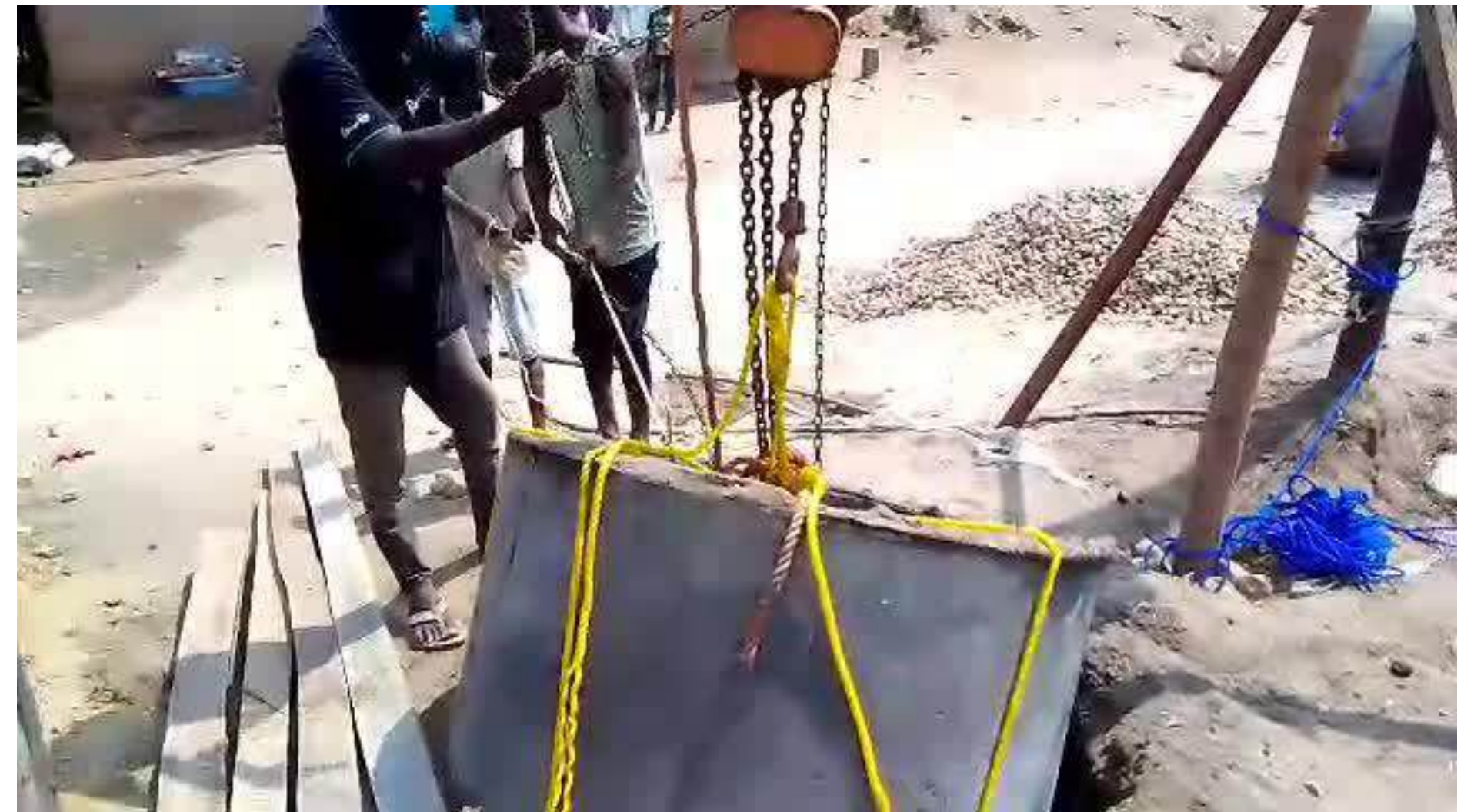
Foto en video: bouwen van de waterpomp wat door de lokale gemeenschap wordt gedaan.