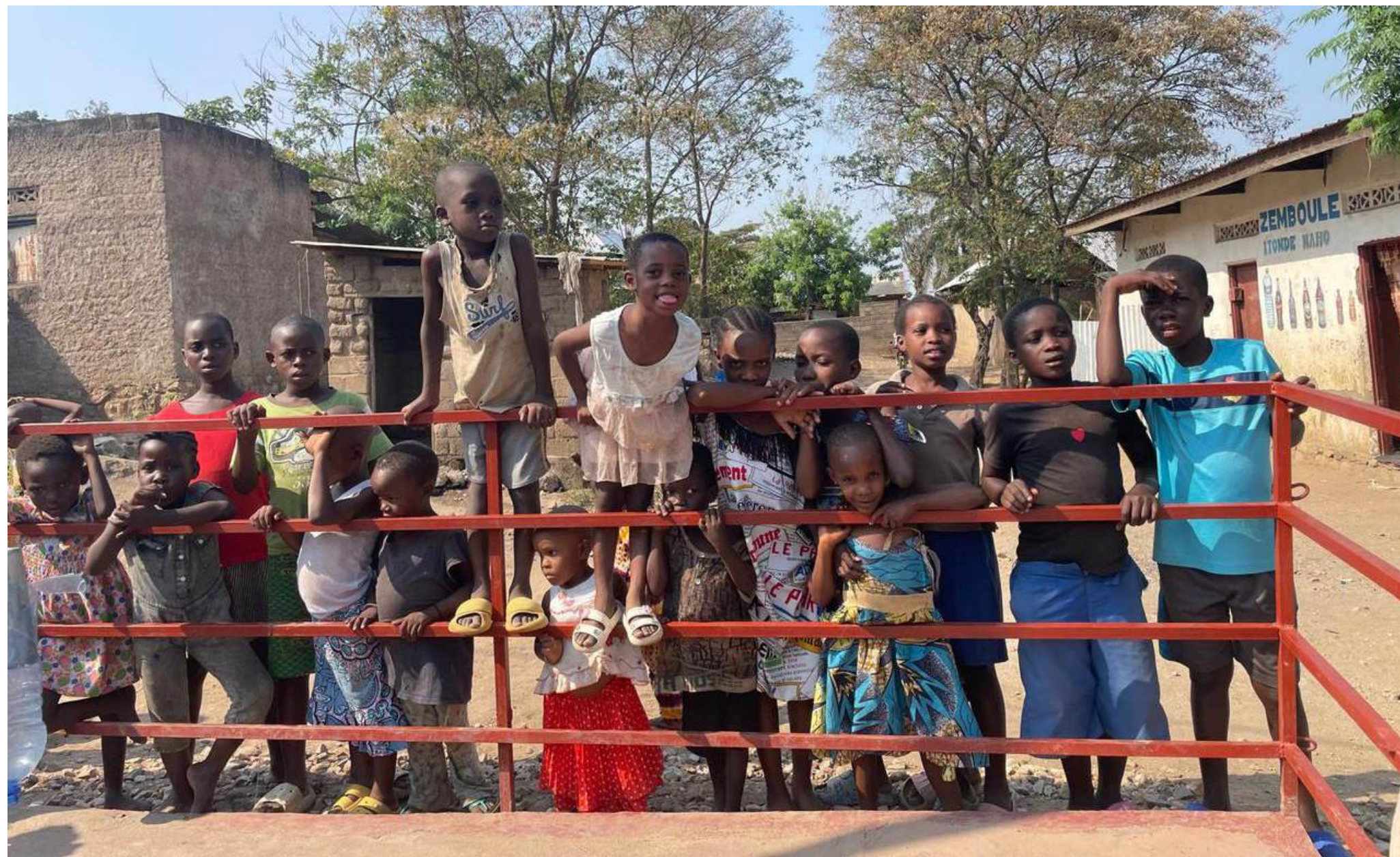
Foto: Kinderen uit de Kasenga wijk die naar het gebruik van de waterpomp kijken. Oktober, 2024.

Tijdens Betteke's laatste reis in Oktober, bezocht ze de waterpomp in Kasenga, waarbij ze aan deze kinderen uit de wijk vertelde dat in Nederland andere kinderen een grote afstand hebben gelopen voor de water pomp - wandelen voor water